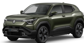
Land Breeze Green Pearl Metallic