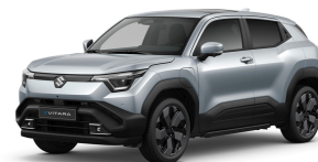
Splendid Silver Pearl Metallic