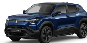
Celestial Blue Pearl Metallic