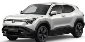
Arctic White Pearl