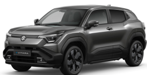
Grandeur Grey Pearl Metallic