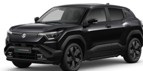
Bluish Black Pearl