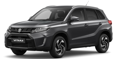
Titan Dark Gray