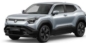
Splendid Silver Pearl Metallic

Внимание! Изображение автомобиля на фото носит иллюстративный характер. Оборудование машины, в т.ч. цвет крыши, корпусов зеркал, рейлингов, капсул на дисках, задних окон и пр. может изменяться в зависимости от оснащения машины.