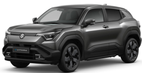
Grandeur Grey Pearl Metallic