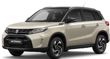
Savanna Ivory / Cosmic Black