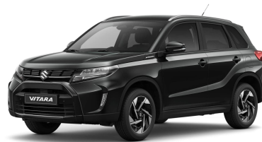
Cosmic Black Metallic