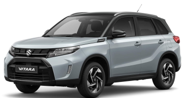
Ice-Grayish Blue / Cosmic Black