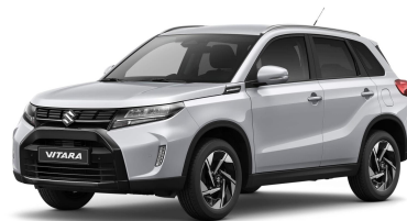
Silky Silver Metallic