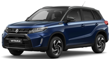
Sphere Blue Pearl / Cosmic Black