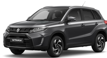
Titan Dark Gray