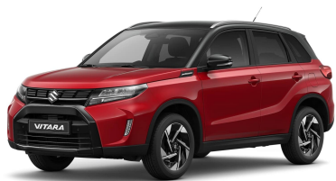
Bright Red / Cosmic Black