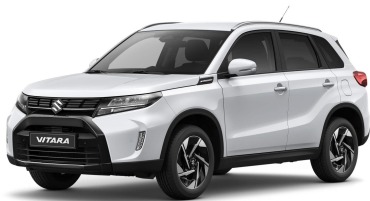
Cool White Metallic