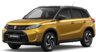
Solar Yellow / Cosmic Black